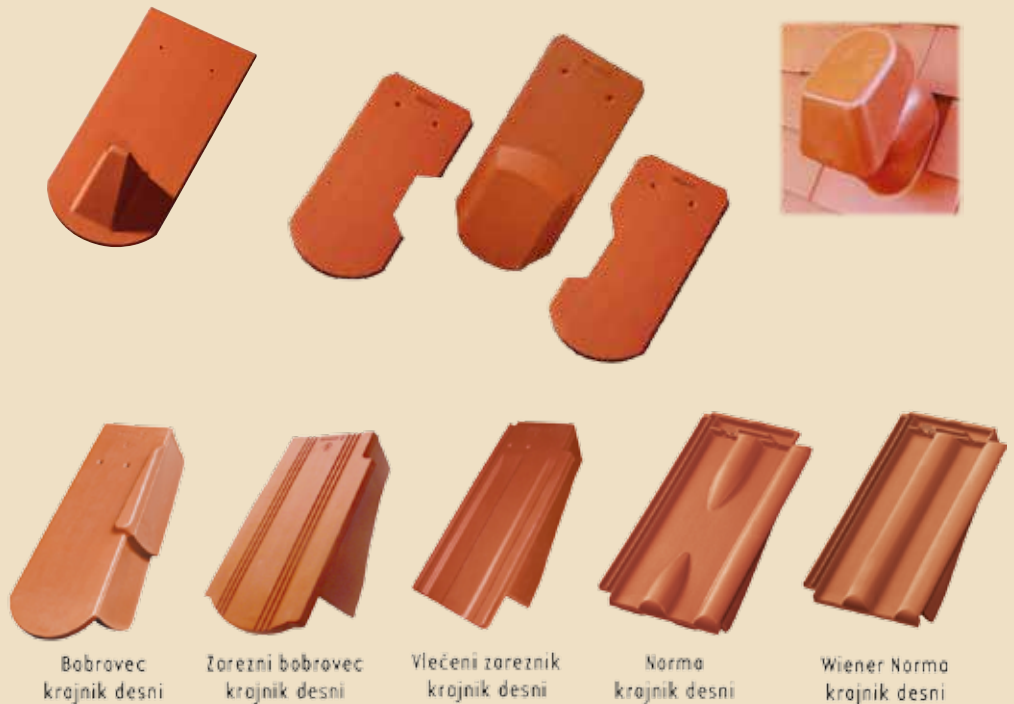
Bobrovec krajnik desni

Opečni krajniki nadomeščajo izvedbo klasičnega zaključka strehe iz pločevine. Tako damo strehi še en detajl, kar jo naredi še lepšo.